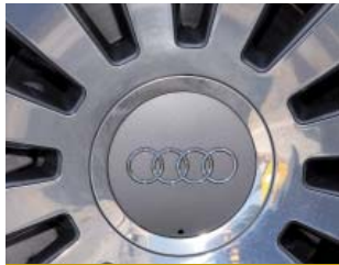
AUDI A8 4.3 TDI QUATTRO