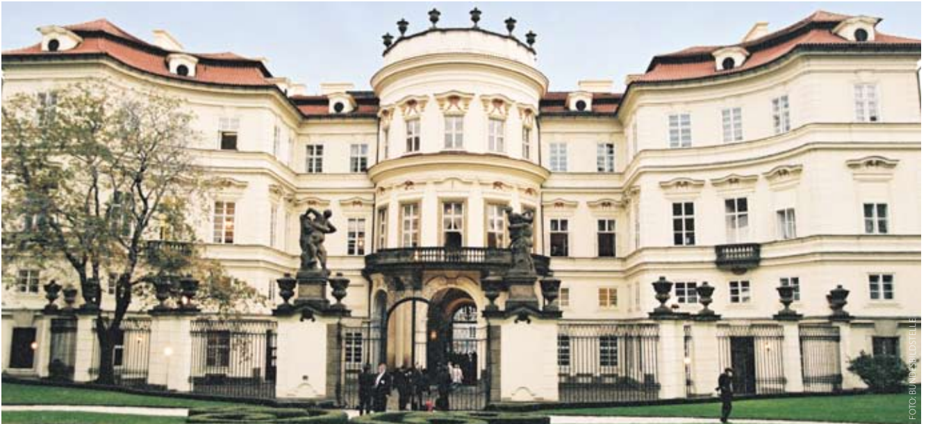
Repräsentieren fürs Vaterland: Nicht alle Botschaftsgebäude der Bundesrepublik Deutschland sind so repräsentativ wie die Prager Botschaft.